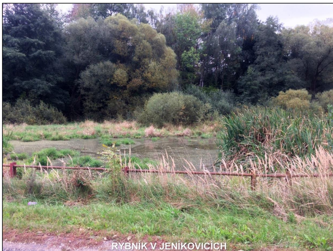
RYBNÍK V JENÍKOVÍCÍCH

V loňském roce jsme podali na MZe žádosti o dotaci na opravu rybníka v Jeníkovcích a obou rybníků v Třebnicích, které jsou v havarijním stavu.