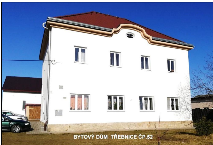
BYTOVÝ DŮM TŘEBNICE ČP.52

rekonstrukce bytového domu č.p. 47, byla vyměněna okna v celém domě, nyní probíhá úprava bytu v přízemí a v dalším roce přijde na řadu oprava střechy. Na nově vybudované cestě z Meclova do Mašovic byly rozmístěny lavičky pro případný odpočinek.