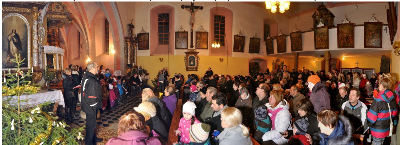
Snímek z ložského zpívání.

Přineste si svůj hrneček na teplé nápoje a přijďte si s námi zazpívat.